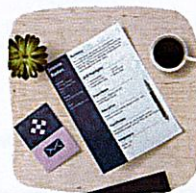
CV / lettre de motivation/ Emploi